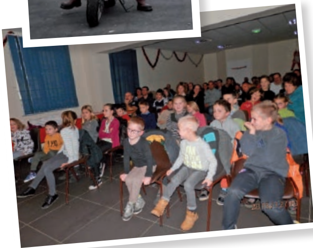
Des enfants attentifs