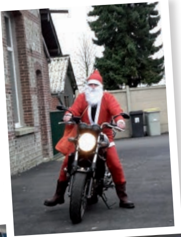
Drôle d'attelage !