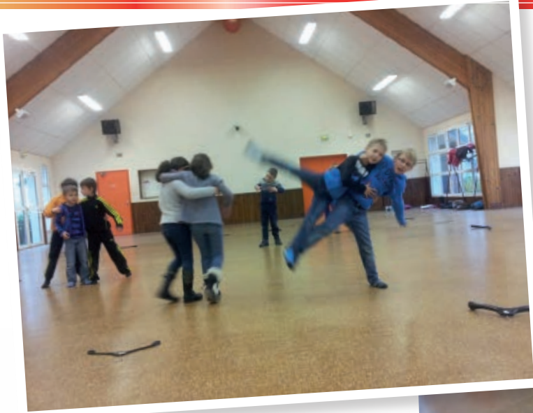
Quelques exercices de danse...