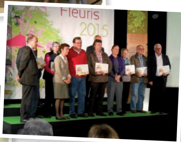
Lauréats fleurissement départemental